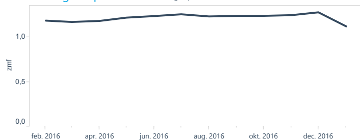
Ziekmeldingsfrequentie (ZMF) afgelopen 12 maanden